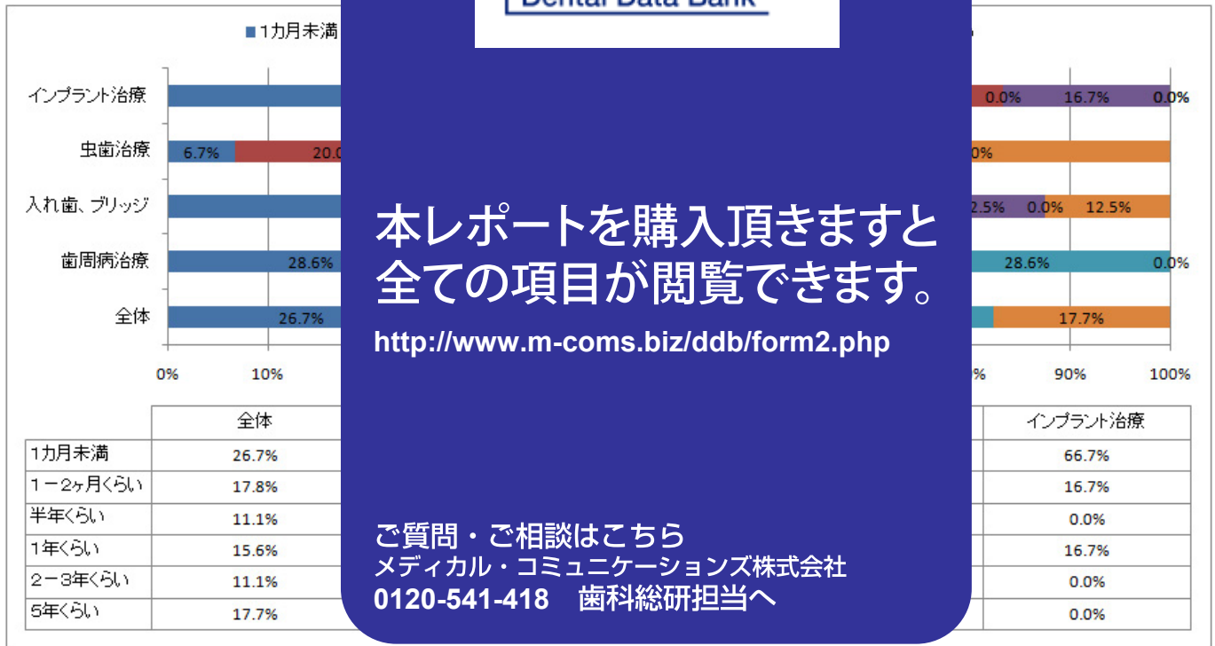
■表2. インプラント治療に至るまでのリードタイム

逆に「虫歯治療」を目的とした患者は、インプラント治療に至るまでに通う期間が1年以上と長く継続的に通ってもらうことで見込患者を蓄積するという観点での患者維持活動が必要になります。